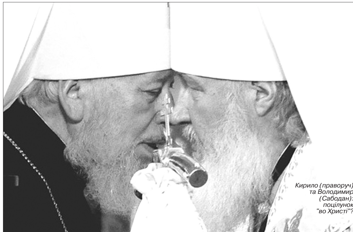
Кирило (праворуч) та Володимир (Сабодан): поцілунок "во Христі"?

Відкритий лист Патріархові РПЦ Кирилу (Гундяєву) з приводу його чергового візиту в Україну