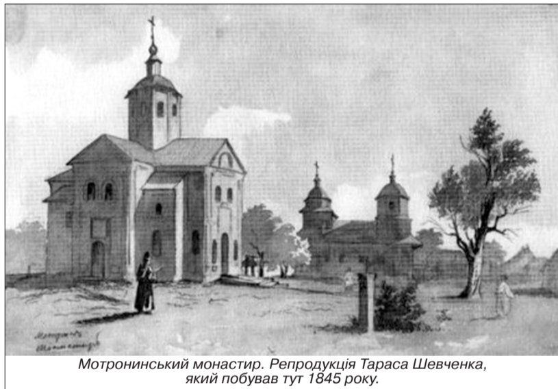
Мотронинський монастир. Репродукція Тараса Шевченка, який побував тут 1845 року.

нин-Лісовський. Народився він 14 січня 1898 року в Полтаві. Назвали його на честь батька Юрія, офіцера російської армії. Мати – Людвіна Соколовська – "вела свій родовід із польсько-шляхетського коріння". Батько, кадровий військовий, благословив сина на здобуття військової освіти, обдарував військовою вдачею. Військову службу Юрій почав "у кавказькій кавалерії" під командою князів хана Нахічеванського та Султан-Гірея, де, за власним визнанням, "хапнув магометанської воєнної етики". Юрій Гордянин-Лісовський – учасник Першої світової війни. В роки національно-визвольних змагань – старшина-кіннотник другого Запорізького полку Запорізької дивізії Армії УНР, до якої вступив у віці 20 років.