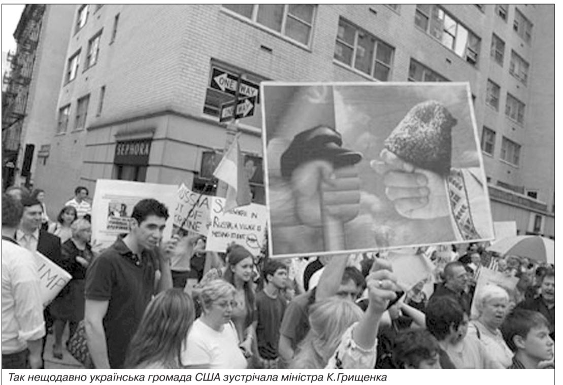
Так нещодавно українська громада США зустрічала міністра К.Грищенка

Зарубіжні українці протестують проти антиукраїнської політики офіційного Києва