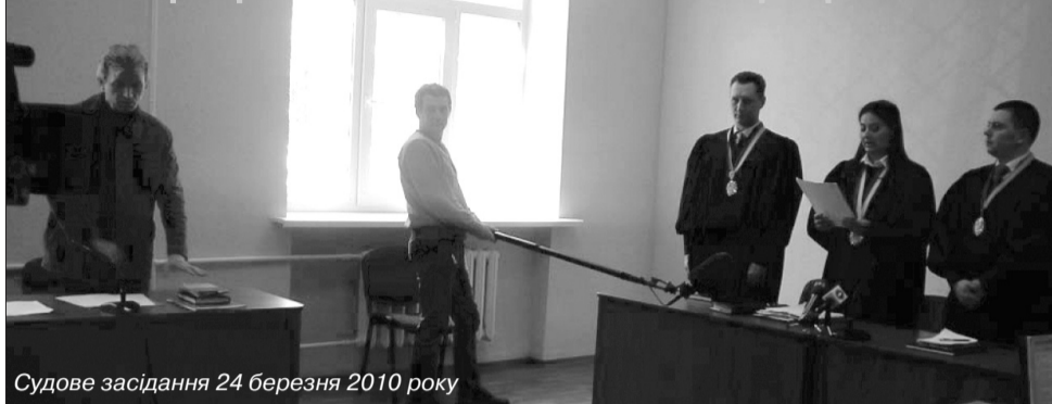
Судове засідання 24 березня 2010 року

У кінці березня в Донецькому окружному адміністративному суді, що знаходиться по вулиці 50-ї Гвардійської дивізії, 17, в м. Донецьку, 83052 пройшли 2 судових засідання, постанови яких виносяться іменем України.