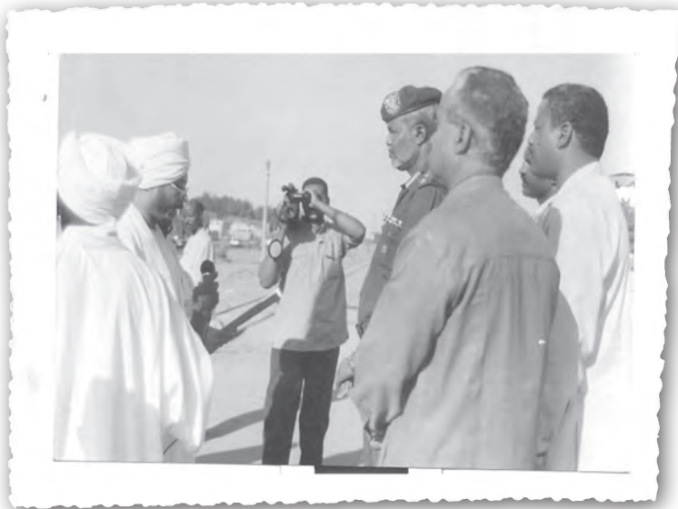
Прочтение и вручение обращения Хизб ут-Тахрир к Вооруженным Силам