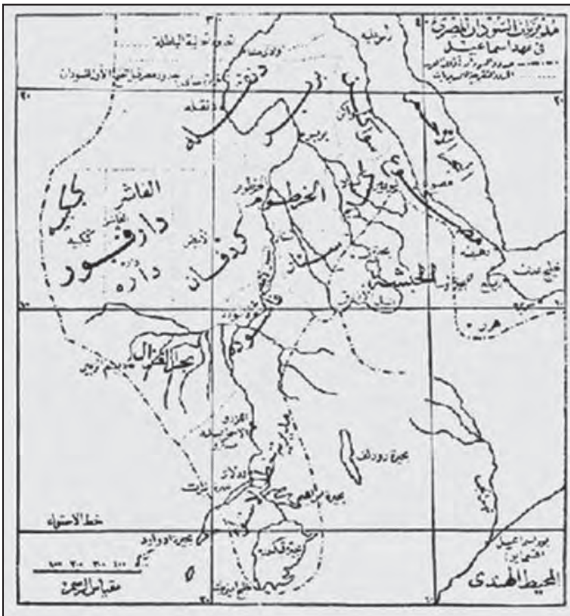
Карта №2: Провинции египетского Судана.

египетские карты Судана и говорят следующее: «Судан является огромной страной, размах которой с севера на юг достигает 1950 миль. Границы Судана можно нарисовать проведя линию от Бернеса на берегу Красного моря на востоке через Ливийскую пустыню до 22 градуса долготы, отсюда на юг до северо-запада Дарфура, примерно до 23