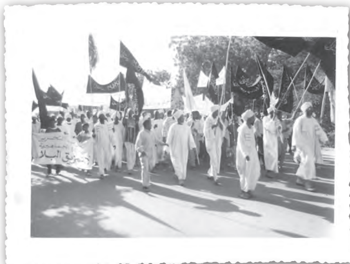
Шествие к Главному командованию Вооруженных Сил