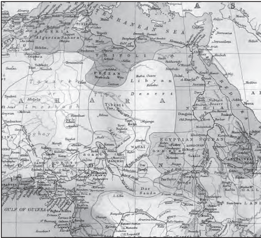
Карта №1: Территории Судана до выдворения британской армии Мухаммадом Ахмадом (махди) в 1885 году.

границах экваториальных лесов в районе Бахр аль-Араб, Бахр аль-Газаль и плотин по причине обилия дождей и мух Цеце, населяющих эти районы, что вредило скоту арабов племени Аль-Баккар, которые в основном живут за счет животноводства. Также сильной человеческой преградой, затруднившей дальнейшее продвижение арабов стали нильские племена, и арabo-исламская культура не смогла преодолеть эти географические и человеческие факторы.