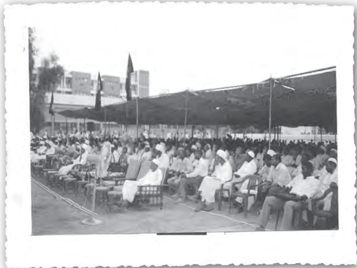
Конференция в университете г. Хартум о соглашении в Найваше