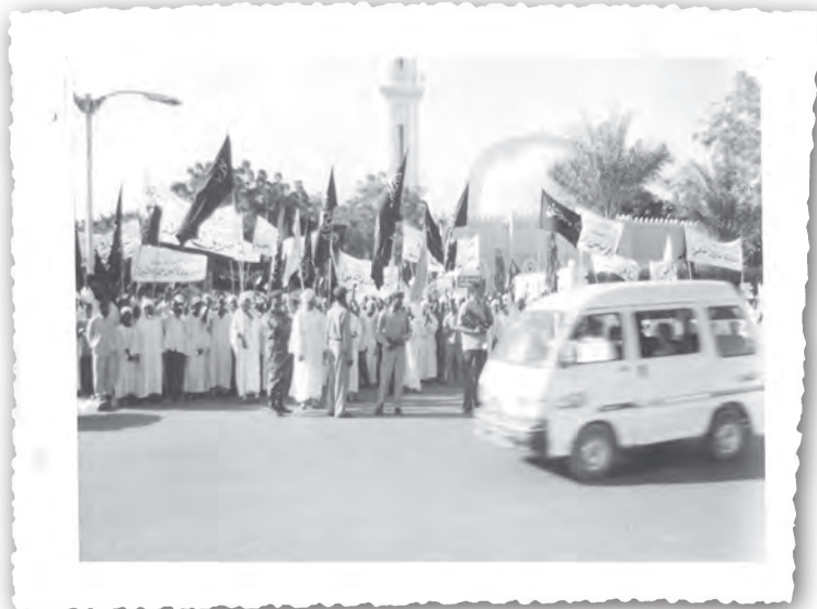
Шествие к Главному командованию Вооруженных Сил