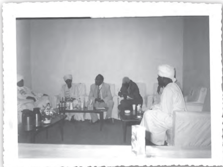
Встреча делегации Хизб ут-Тахрир с членами Конституционного Управления и вручение им проекта конституции исламского государства Халифат